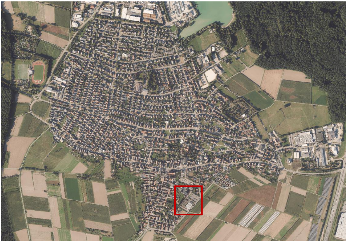
Luftbild (ohne Maßstab)